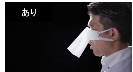
「しゃべれるくん」なし(上)あり(下)で、あきらかな違いが見えた。